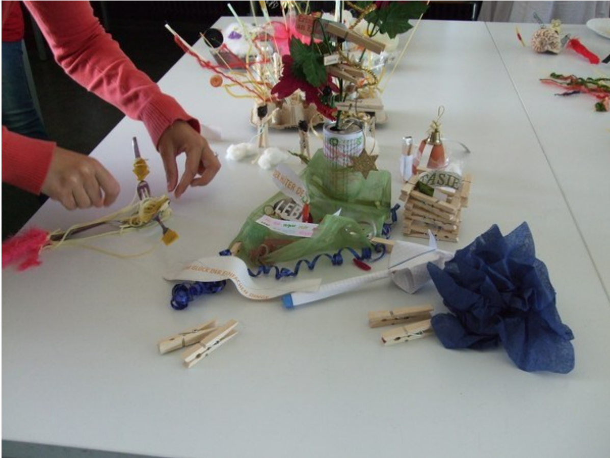
Abb. 4: SeminarteilnehmerInnen im Umgang mit verschiedenen Materialien im Rahmen des Seminars „Spiel und Spiel/Zeug als Gegenstand der Kindheitsforschung, der Ästhetik und der Kulturanthropologie. Kulturpädagogisch und interkulturell orientierte Annäherung“ (SS 2010, Prof. Dr. B. Engel [Foto], Fakultät für Erziehungswissenschaft der Universität Bielefeld)