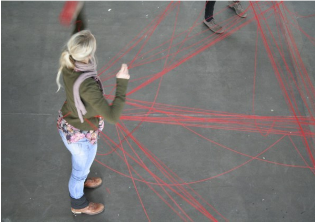
Abb. 1: Körper, Bewegung, Interaktion - Performance im Seminar „Kunstpädagogik als Kritik“ (WS 2011/12, Prof. Dr. Engel, K. Böhme [Foto] Kunstakademie Münster)

Über die utopischen Potenziale eines nicht in seiner sprachlichen Bestimmbarkeit aufgehenden Begriffs im kunstdidaktischen Feld