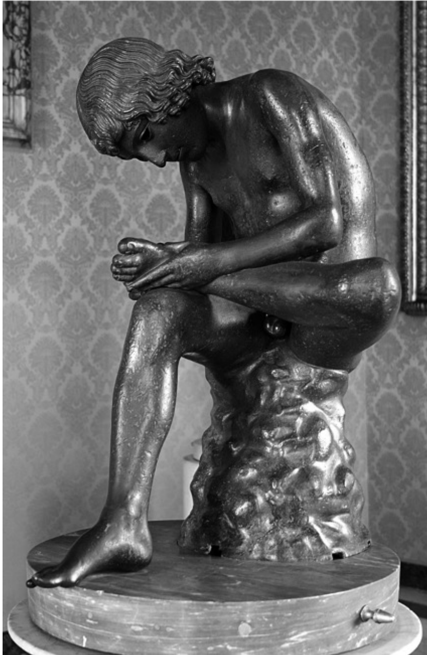
Abb. 2: Kapitolinischer Dornauszieher