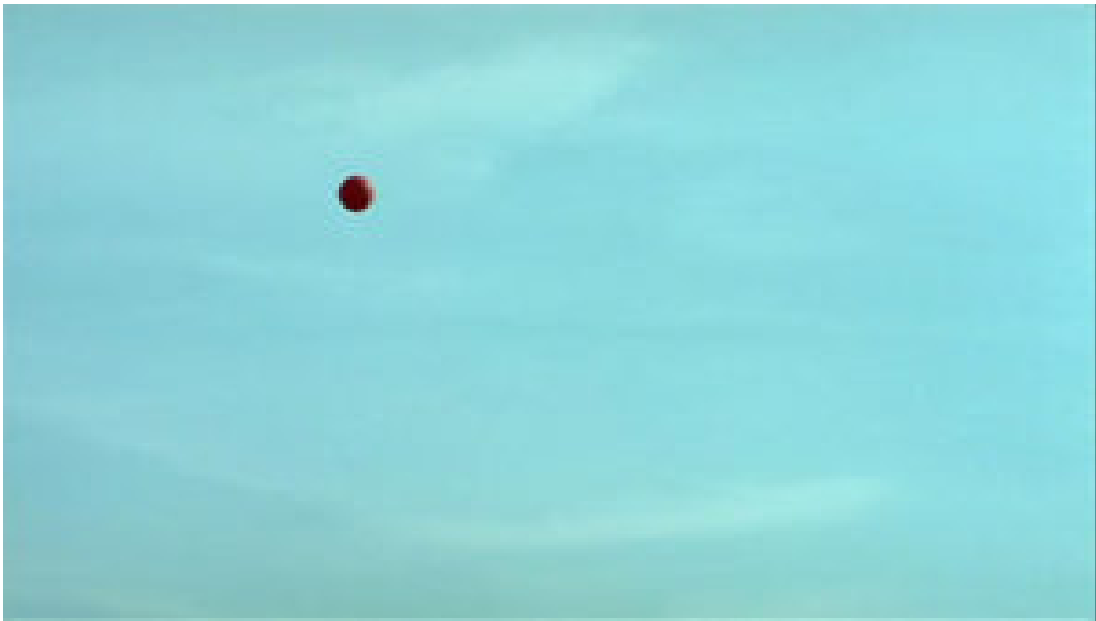
Im Musée d'Orsay: Die letzte Szene aus "Die Reise des roten Ballons" (Abb. 1-14)

In dieser Szene überlagern sich im Sinne der oben genannten Definition drei verschiedene Formen der Mise en scène : die Szenografie des Museumsraums, die Museumspädagogik und die Kameraführung. Die Szenografie des Museumsraums organisiert – über die Architektur, über die Anordnung der Kunstgegenstände im Raum, über Sitzgruppen und Infotafeln – die Bewegungen und Blicke der Besucher/-innen und legt eine bestimmte Haltung (der Ehrfurcht, der Stille, der Kontemplation) zu den Kunstwerken nahe. Zuerst aus einer schiefen Perspektive von oben (in Aufsicht) gezeigt (Abb. 2), deutet sich an, dass dieser Raum nicht unbedingt für Kinder konstruiert wurde und dass diese ihn eigenwillig nutzen: Nur wenige schauen zu den auf Podesten über ihrer Augenhöhe positionierten Skulpturen auf. Andere unterhalten sich miteinander oder erproben die Beschaffenheit des Bodens, indem sie darauf rutschen.