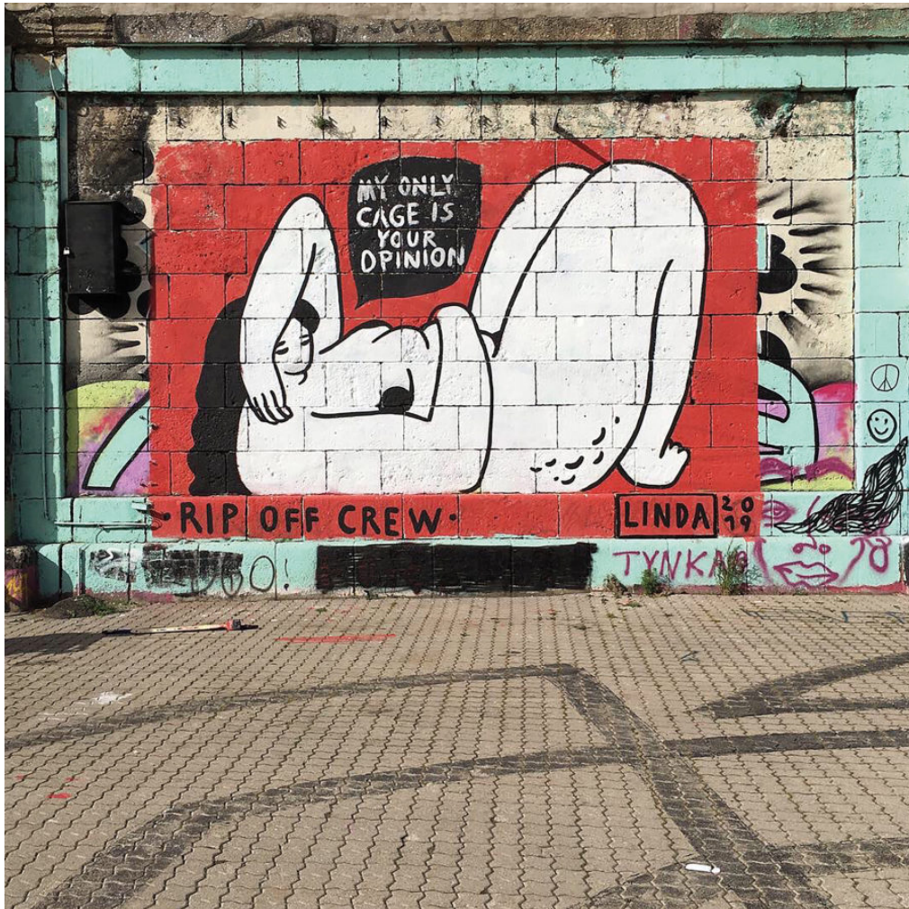
Abb. 2: My only cage is your opinion, Linda Steiner 2019