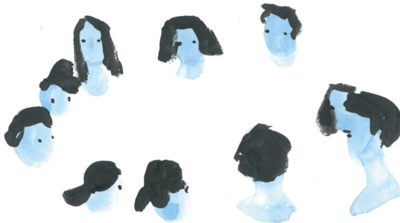
Abb. 1: Künstlerische Dokumentation des Workshops, Linda Steiner 2019

Mit einer Reihe an Fortbildungsmöglichkeiten für uns als Projektmitarbeitende stellte Imagining Desires den dafür notwendigen Raum zur Verfügung. 3 Anhand von Einblicken in einen Workshop mit der Performance-Künstlerin Elisabeth Löffler zu differenzreflektierender 4 Körperarbeit möchte ich beispielhaft darstellen, welchen Beitrag die Auseinandersetzung mit künstlerischen Arbeiten bei der Dekonstruktion hegemonialer Wahrnehmungs- und Darstellungsmuster leisten kann. 5