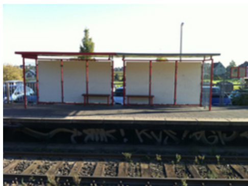
Abb. 1: Bahnstation in Alfter

kurz nachzudenken und dann mit der nächsten Bahn zurückzufahren bis zu der Station, hinter der sich die Linien gabeln, griffen beide zu ihren Handys und riefen ihre Eltern an, die herauszubekommen versuchten, wo ihre desorientierten Kinder nun steckten, um sie dort mit dem Auto abzuholen. Das wird dann wohl auch geschehen sein. Die Erfahrung, dass sie – sogar zu zweit – selbst in der Lage sind, gegen die ihnen Angst machende Lage etwas zu unternehmen, haben die beiden Mädchen nur in sehr geringem Umfang gemacht, jedenfalls wahrscheinlich in sehr viel geringeren als ohne Mobiltelefone und die durch diese leicht herzustellenden Sicherheitsleinen, welche die durch die Möglichkeit, andauernd zu telefonieren, gewonnene Freiheit auch wieder einschränkt. Meines Wissens gibt es zu derartigen Langzeitwirkungen von Medienneuerungen so gut wie keine Studien. Sie würden auch nicht in die üblichen wissenschaftlichen Projektablaufzeitlängen passen.