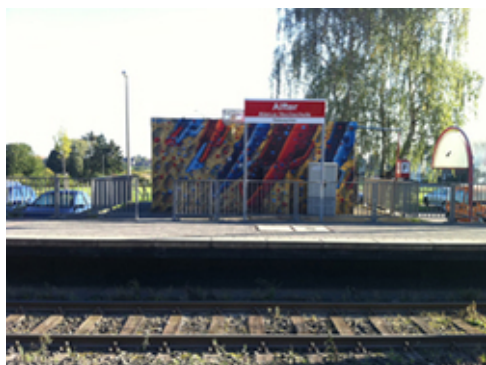
Abb. 2: Bahnstation in Alfter