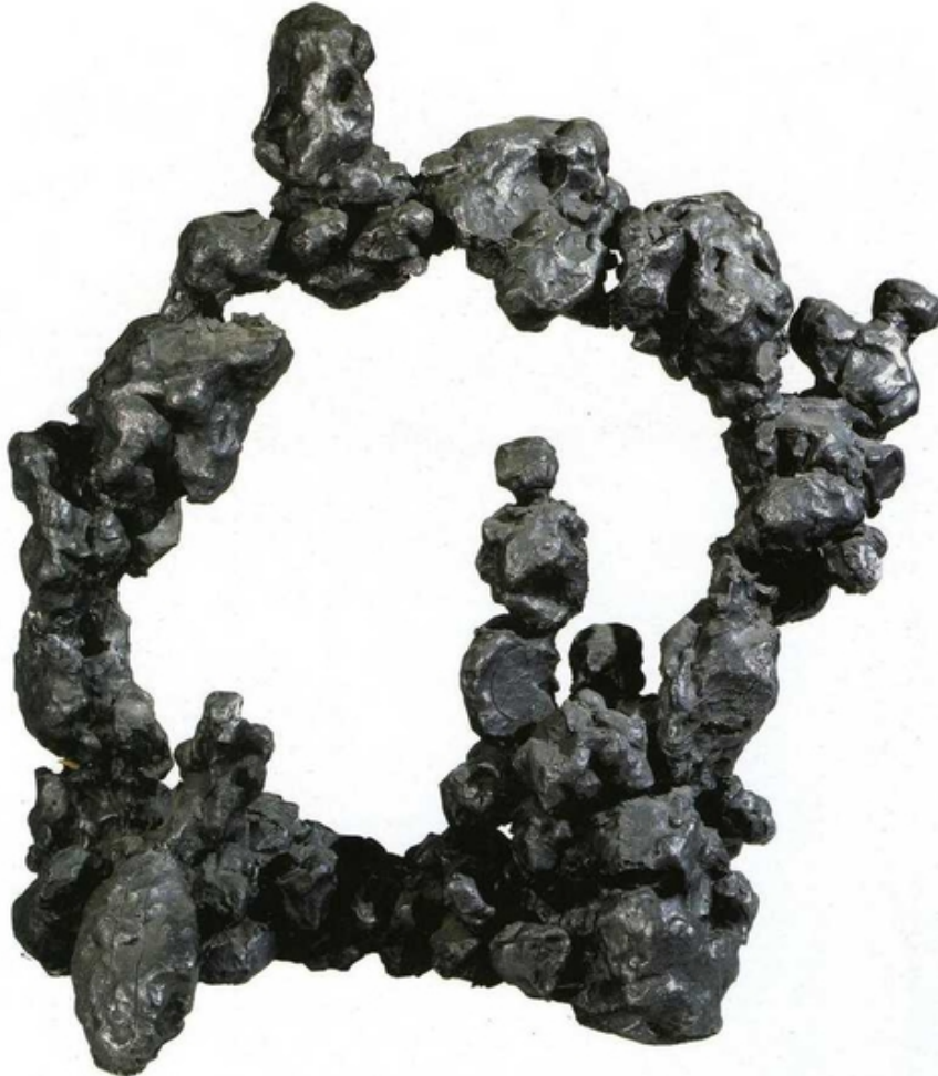
Abb. 1: Lucio Fontana: Scultura spaziale , 1947, ursprünglich Gips, hier Version in Bronze, 59 × 50 cm, Mailand, Fondazione Lucio Fontana

Fontanas erstes Concetto spaziale („räumliches Konzept“) war eine schwarz bemalte Gipsplastik, 1947 entstanden, die er zunächst gattungsbezogen als Scultura spaziale bezeichnete (vgl. de Sanna 1993: 57-61, Schütze 2010: 27, Schütze 2011a: 10ff.). Diese Plastik besteht aus kugelartigen, grob geformten Elementen. Sie sind zu einem Bogen zusammengefügt, aus dem an mehreren Stellen unregelmäßige Verästelungen herausragen. Das an petrifizierte Erdformationen oder urtümliches Lavagestein erinnernde Gebilde umschließt einen Teil des Raums und macht ihn durch die kreisförmige Rahmung sichtbar, ohne ihn tatsächlich zu begrenzen. Fontana findet so eine bildliche Formel für die physikalische Grenzenlosigkeit des Raums. Durch die Urtümlichkeit seines Äußeren erweckt das erste Concetto spaziale zudem Assoziationen an Entstehungsprozesse der Erde und des Universums.