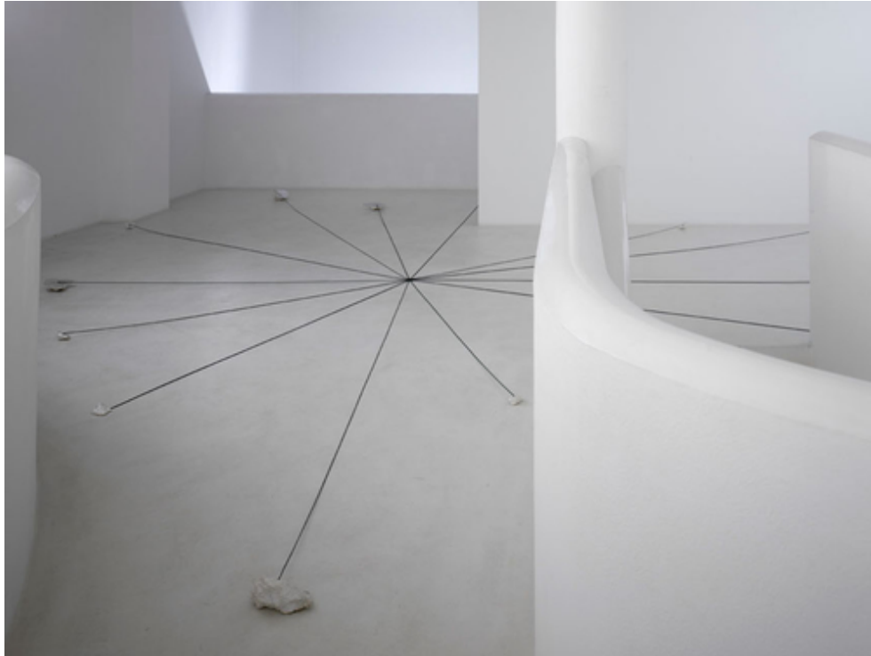
Abb. 9: Gianni Caravaggio: Testimone di uno spazio antico, 2009/10, versilberte Bronze, Propylenschnur, Silber-ring, variable Maße

In letzter Zeit beschäftige ich mich mit der Frage: Gibt es überhaupt Bilder, Vorstellungen, die für den Menschen universell sind? Das heißt: gibt es „erste Bilder“ bzw. Vorstellungen, die die Menschheit wahrgenommen hat und die den Menschen geprägt haben? Dahingehend versuche ich zu arbeiten.“ (Caravaggio 2011: 65f.)