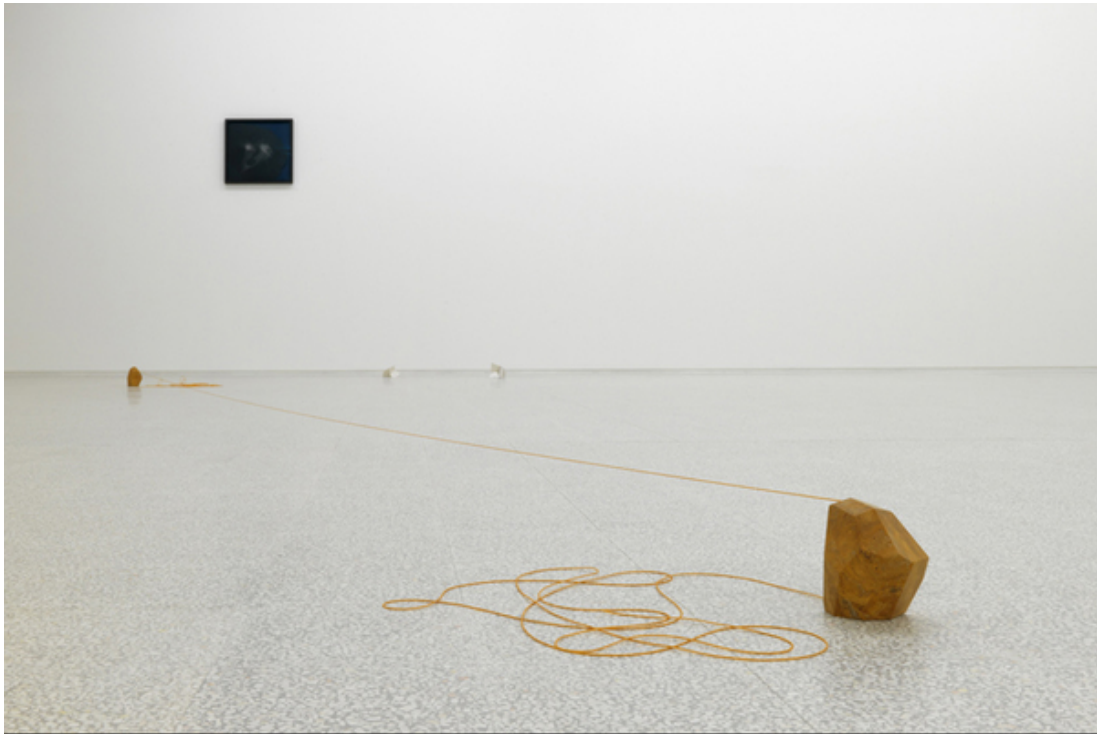
Abb. 10: Gianni Caravaggio: Tessitori di albe, 2011, Kunststofffaden, gelber Travertin-Marmor aus Persien, Collezione Maramotti, Reggio Emilia | © Gianni Caravaggio, 2013

Um jene „Leerstellen“ zu schaffen, die es dem Betrachter ermöglichen, seine inneren Bilder abzurufen, arbeitet Caravaggio in seinen Installationen mit den Kunstgriffen des Fragmentarischen und der Andeutung. Die Titel der Werke geben häufig Orientierung, auf welche spezifische Bilder angespielt wird bzw. um eine Beziehung zu dem bildlich Angedeutetem zu erzeugen. Dies ist auch bei der 2011 entstandenen Installation der Tessitori di albe , der „Sonnenaufgangsweber“, der Fall: Zwischen zwei steinernen, geometrischen Objekten, die in einem Abstand von einigen Metern auf dem Boden liegen, ist ein roter Faden straff gespannt. Beide Objekte orientieren sich in Größe und Form an den Händen des Künstlers, die die Geste des Faden-Spannens vollziehen. Der Titel „Sonnenaufgangsweber“ wirkt wie ein Initiator, der die „immaginazione“ beim Betrachten der Installation in eine bestimmte Richtung lenkt: Der Ausgang der Sonne kündigt sich durch ein rotes Band am Horizont an. Das angedeutete Bild kann der Betrachter nun „weilerspinnen“ oder, um in der Metaphorik des Titels zu bleiben: „weiterweben“.