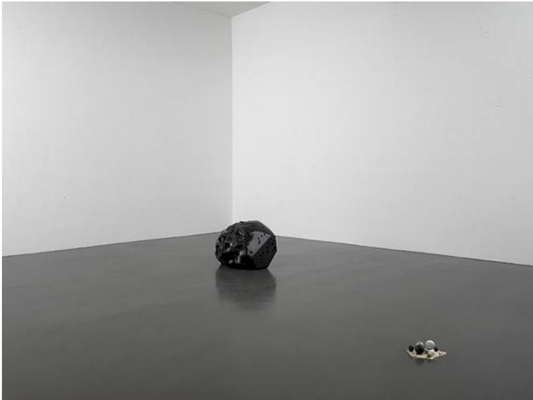
Abb. 8: Gianni Caravaggio: Principio con Testimone, 2008, versilberte Bronze, Marmor, Aluminium, schwarze und gelbe Sojabohne, schwarzer belgischer Marmor, variable Installationsmaße, Courtesy Collezione Maramotti, Reggio Emilia u. Sies+Höke, Düsseldorf | © Gianni Caravaggio, 2013