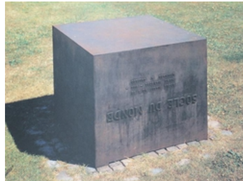
Abb. 7: Piero Manzoni: Socle du monde, 1961, Eisen, Bronze, 82 x 100 x 100 cm, Herning Kunstmuseum

Zu letzteren zählt die Plastik Socle du monde („Sockel der Welt“, 1961), die regelrecht das „Ausloten“ der Vorstellungswelt des Betrachters einfordert. (8) Ein quaderförmiger Sockel aus Eisen trägt auf seiner Seite die auf dem Kopf stehende Beschriftung „SOCLE DU MONDE“. In kleineren Lettern darunter folgt die ebenfalls auf dem Kopf stehende Hommage an Galileo Galilei, dem Verfechter eines heliozentrischen Weltbildes. Der Platz, der bei „normaler“ Betrachtung für das Kunstwerk vorgesehen ist, bleibt indessen frei, ist „Leerstelle“. Der Betrachter muss seine Vorstellungswelt und seine eigene Position gedanklich „auf den Kopf stellen“, um das Bild der auf einem Sockel ruhenden Erdkugel vor seinem inneren Auge entstehen zu lassen. Manzoni evoziert mit seinem Kunstwerk auch hier wieder ein Abrufen innerer Bilder. Dabei mag dem Betrachter das im kollektiven Bewusstsein verankerte Bild des Atlas behilflich sein, der in der griechischen Mythologie die Welt auf seinem Rücken trägt. Die Diskrepanz der tatsächlichen Machtlosigkeit des Betrachters zu seinem „weltbewegenden“ Gedankenexperiment lässt wiederum jene ironische Note spürbar werden, die viele Arbeiten Manzonis auszeichnet.