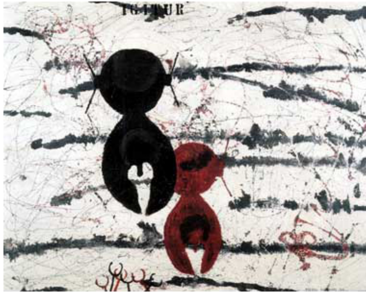
Abb. 6: Piero Manzoni: Igitur, 1957, Öl auf Leinwand, 70 x 90 cm, Privatsammlung | © VG Bild-Kunst, Bonn 2013