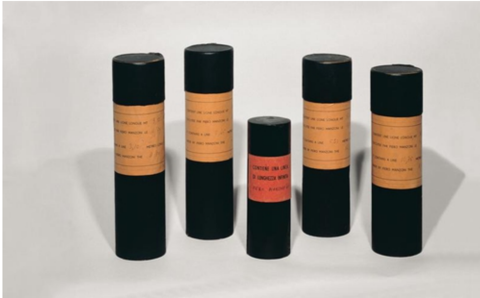
Abb. 5: Piero Manzoni: Linea 3,10, Linea 16,65, Linea di lunghezza infinita, Linea 5,63, Linea 10,75, 1959, diverse Mae, Tinte auf Papier, Behalter aus Pappe, Sammlung Nanda Vigo |  VG Bild-Kunst, Bonn 2013

wird hier nun ein Bild provoziert, das in seiner irdischen Konkretheit und Alltaglichkeit kaum bertroffen werden kann.