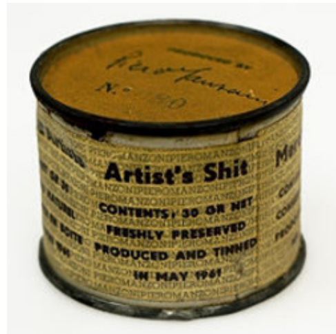
Abb. 4: Piero Manzoni: Merda d'artista, 1961, Metalldose, Papier, Fäkalien, 4,8 x 6 cm, Mailand, Museo del Novecento

Bilder angesprochen, die nach Gaston Bachelard in den Bereich der zone intermédiaire gehören, die zwischen rationalem Bewusstsein und Unbewusstem angesiedelt ist (vgl. Bachelard 1938). (4) Fontanas Arbeiten aus den Werkgruppen der Bucchi und Tagli sind materielle „Bild-Objekte“, die mentale Bilder evozieren. Die Aktivität der „immaginazione“, der Vorstellungskraft, fokussiert sich nicht allein auf die künstlerische Handlung – das Perforieren und Aufschlitzen von Leinwänden –, sondern wird auf den Betrachter und seine Wahrnehmungsbearbeitung ausgedehnt. Die Zusatztitel „Attesa“ bzw. „Attese“ können auch in diesem Sinne als „Erwartungen“ an die Vorstellungskraft des Rezipienten verstanden werden, innere Bilder von der Unendlichkeit des Raums entstehen zu lassen, die sich der konkreten Darstellung entziehen.