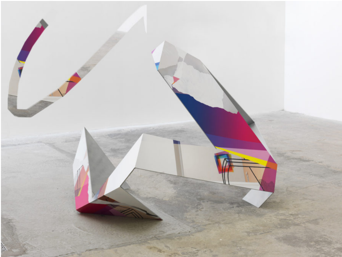
Abb. 4: Artie Vierkant: Image Object , SATURDAY, 10 AUGUST 2019 9:21:10 PM

Die Installationsansichten werden zur Erweiterung der ausgestellten Objekte und beeinflussen wiederum, welche weiteren Formen die Arbeit annimmt. Die Unterscheidung zwischen primärer und sekundärer Rezeption ist hier hinfällig, da die Arbeit in jeder Situation durch andere, spezifische ästhetische Qualitäten charakterisiert ist. 12 Die Augmented-Reality-App der Image Objects 13 eröffnet eine weitere Ebene und ermöglicht die Navigation durch und Interaktion mit der Arbeit in Überlagerung und Wechselwirkung screenbasierter, prozessualer und physischer Materialität.