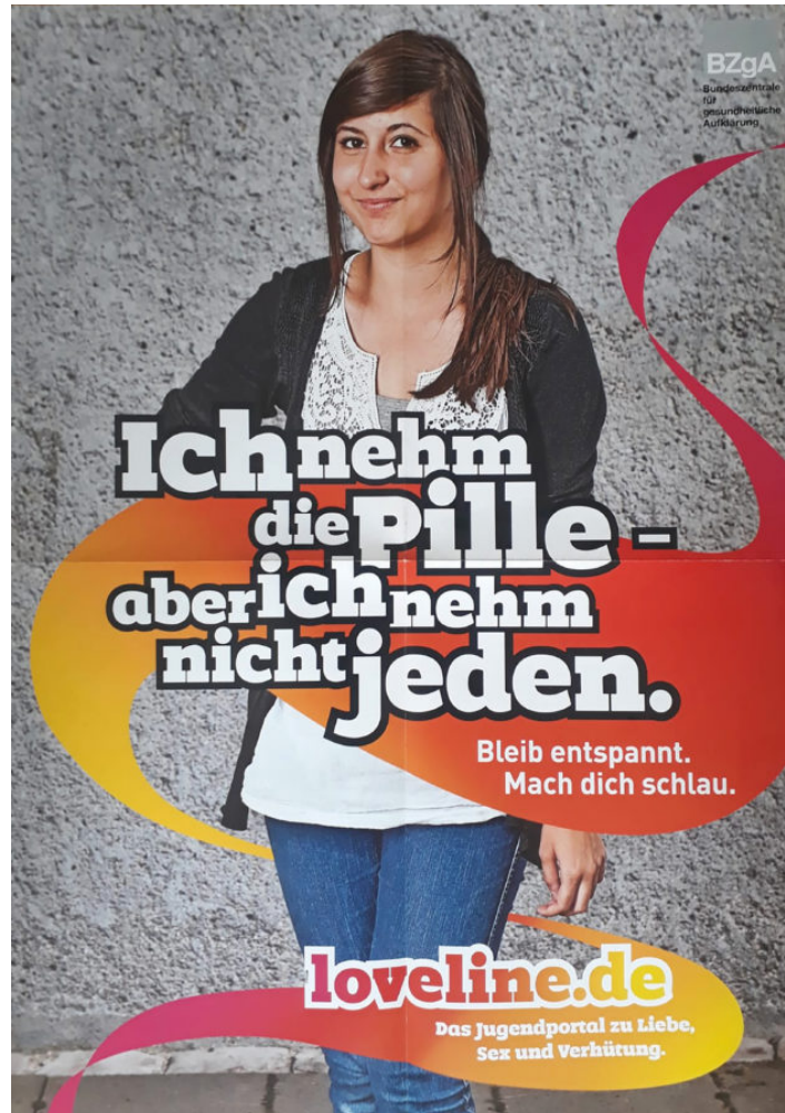
Abb. 3: Einzelposter aus dem Posterset des BZgA-Arbeitsmanual Bleib entspannt. Mach dich schlau (2015)