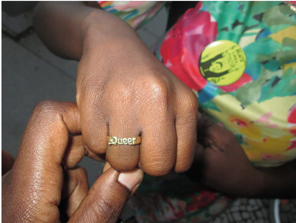
Abb. 4: 'Black_Marxist-Feminist_Queer' and '#BlackQueerLivesMatter' (Ring und Button) 4