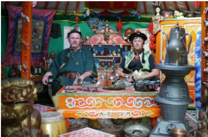
Abb. 14: Timen Kublai und Chabi in ihrer Jurte.