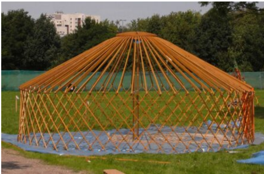
Abb. 9: Jurte im Aufbau.