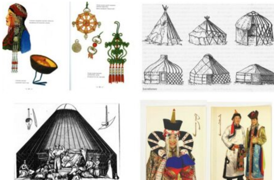
Abb. 10-13: Mongolische Trachten, Burjatische Trachten, tanzende und musizierende Kalmücken in Jurte.