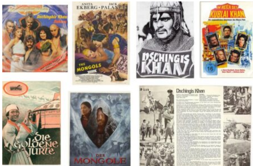
Abb 2-8: verschiedene Filmplakate und DVD-Cover.