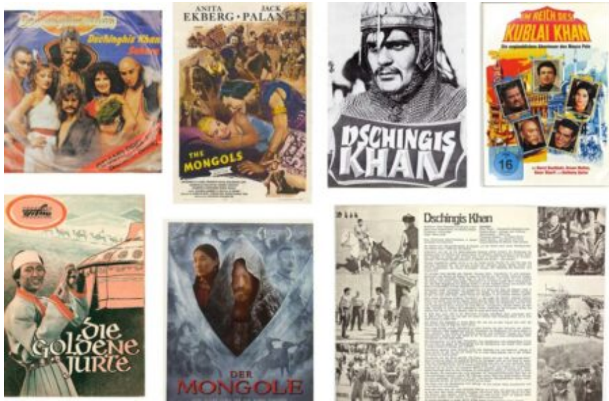
Abb 2-8: verschiedene Filmplakate und DVD-Cover.