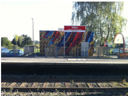
Abb. 2: Bahnstation in Alfter