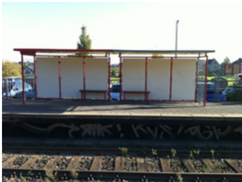
Abb. 1: Bahnstation in Alfter

kurz nachzudenken und dann mit der nächsten Bahn zurückzufahren bis zu der Station, hinter der sich die Linien gabeln, griffen beide zu ihren Handys und riefen ihre Eltern an, die herauszubekommen versuchten, wo ihre desorientierten Kinder nun steckten, um sie dort mit dem Auto abzuholen. Das wird dann wohl auch geschehen sein. Die Erfahrung, dass sie – sogar zu zweit – selbst in der Lage sind, gegen die ihnen Angst machende Lage etwas zu unternehmen, haben die beiden Mädchen nur in sehr geringem Umfang gemacht, jedenfalls wahrscheinlich in sehr viel geringeren als ohne Mobiltelefone und die durch diese leicht herzustellenden Sicherheitsleinen, welche die durch die Möglichkeit, andauernd zu telefonieren, gewonnene Freiheit auch wieder einschränkt. Meines Wissens gibt es zu derartigen Langzeitwirkungen von Medienneuerungen so gut wie keine Studien. Sie würden auch nicht in die üblichen wissenschaftlichen Projektlaufzeitlängen passen.