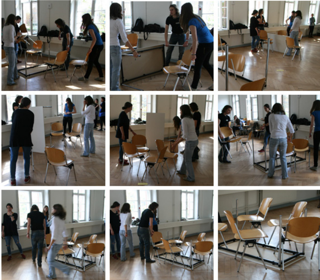
Abb. 2-10: Verfahrensimmanentes Oszillieren: experimentell-reflexive Schleifenbewegung. Übung im Seminar ‚Forschungstheater: Szenisches Forschen nach den Verfahren des Theaters der Unterdrückten‘ (SoSe2012, Leuphana Universität Lüneburg, Komplementärstudium, Perspektive: Kunst und Ästhetik).

Reflexion (vgl. exemplarisch Heckmair/Michl 1998: 182-185), wird hier auf das Dynamische, Ineinanderübergehende, Achronologisch-Gleichzeitige ästhetischer Herstellungsprozesse verwiesen.