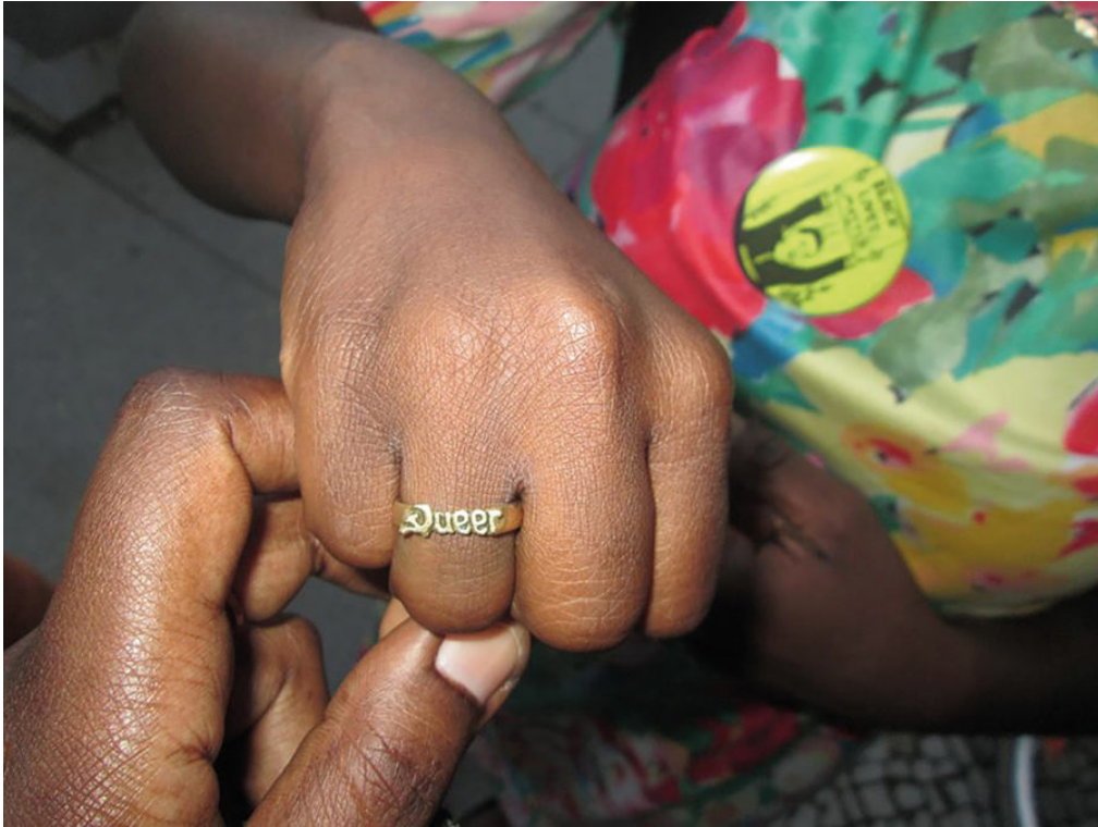
Abb. 4: 'Black_Marxist-Feminist_Queer' and '#BlackQueerLivesMatter' (Ring und Button) 4