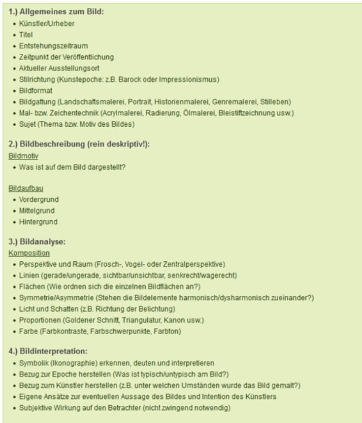
Abb. 3) Aufbau Bildanalyse (aus: http://www.abipedia.de/bildanalyse.php , abgerufen am 29.08.2021)

Es sind vier klar getrennte und aufeinander aufbauende Schritte vorgegeben. Diese Struktur wird auch im Begleittext hervorgehoben: „Die Bildbeschreibung darf nicht schon teilweise in der Einleitung erfolgen [...]“; „Nach vollständiger Bildbeschreibung beginnt die eigentliche Bildanalyse“; „[D]ie Bildbeschreibung [nimmt] einen nicht unwichtigen Teil ein, den man auch von der Bildinterpretation klar trennen muss“; „Den letzten Teilschritt [...] stellt die Bildinterpretation dar“