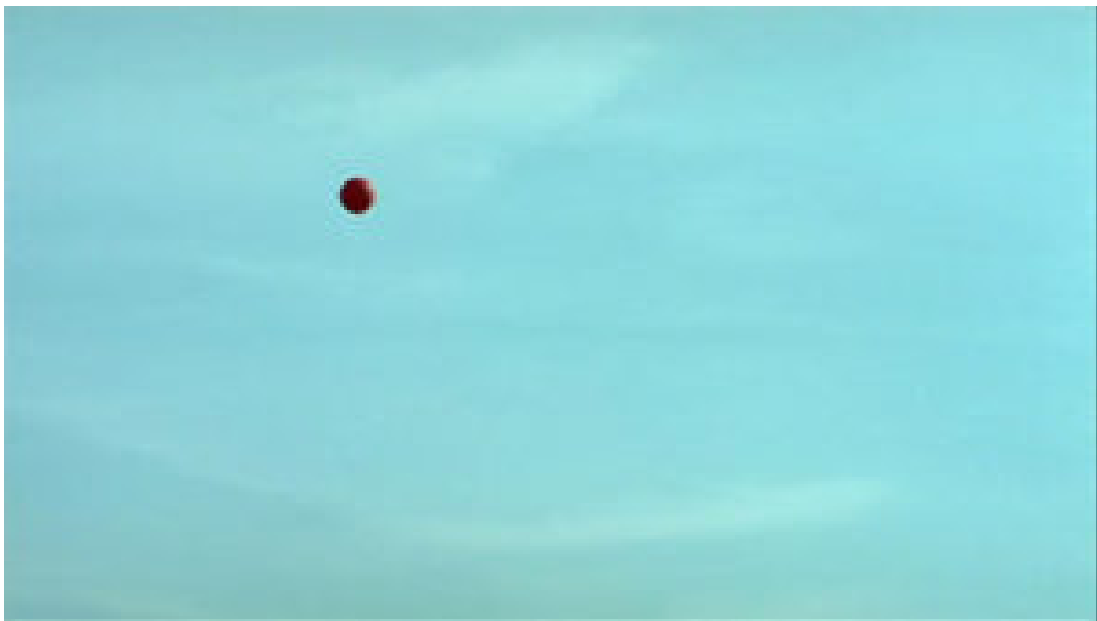
Im Musée d'Orsay: Die letzte Szene aus „Die Reise des roten Ballons“ (Abb. 1-14)

In dieser Szene überlagern sich im Sinne der oben genannten Definition drei verschiedene Formen der Mise en scène : die Szenografie des Museumsraums, die Museumspädagogik und die Kameraführung. Die Szenografie des Museumsraums organisiert – über die Architektur, über die Anordnung der Kunstgegenstände im Raum, über Sitzgruppen und Infotafeln – die Bewegungen und Blicke der Besucher/-innen und legt eine bestimmte Haltung (der Ehrfurcht, der Stille, der Kontemplation) zu den Kunstwerken nahe. Zuerst aus einer schiefen Perspektive von oben (in Aufsicht) gezeigt (Abb. 2), deutet sich an, dass dieser Raum nicht unbedingt für Kinder konstruiert wurde und dass diese ihn eigenwillig nutzen: Nur wenige schauen zu den auf Podesten über ihrer Augenhöhe positionierten Skulpturen auf. Andere unterhalten sich miteinander oder erproben die Beschaffenheit des Bodens, indem sie darauf rutschen.