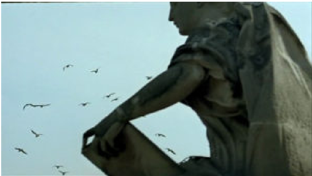
Der Blick des Kindes in „Die Reise des roten Ballons“ (Abb. 15-25)