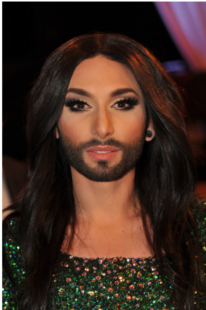
Abb. 1: Conchita Wurst, 2014

nur auf die Geschichte des Phönix und die Botschaft des Songs. Die visuelle Inszenierung der Kunstfigur Conchita Wurst (Abb. 1) erinnert an zahlreiche Jesusbilder der Nazarener Anfang des 19. Jahrhunderts (Abb. 2) (Vgl. Pahud de Mortanges 2016: 240f sowie ORF 2014). Die weichen Gesichtszüge und der Vollbart zeigen ein feminisiertes Jesusbild, das als Sinnbild für die Liebe steht. Da Gefühle tradierter Weise auch geschlechtsspezifisch konnotiert sind und Liebe (im Gegensatz zu Aggression beispielsweise) einer Sphäre der ‚Weiblichkeit‘ zugeschrieben wird, erhält Jesus in den Darstellungen androgyne Gesichtszüge mit dem Zweck, Liebe zu vermitteln. Eine direkte Gegenüberstellung von Conchita Wurst und dem Jesusbild der Nazarener macht diese Parallelen deutlich. Des Weiteren wird mit dieser Jesusdarstellung an die Vorstellung einer Geschlechtervielfalt im Göttlichen angeknüpft. In einigen Religionen und Kulturen gibt es Traditionen, wo das dritte Geschlecht (Hijras) eine besondere spirituelle Bedeutung und Funktion innehat.