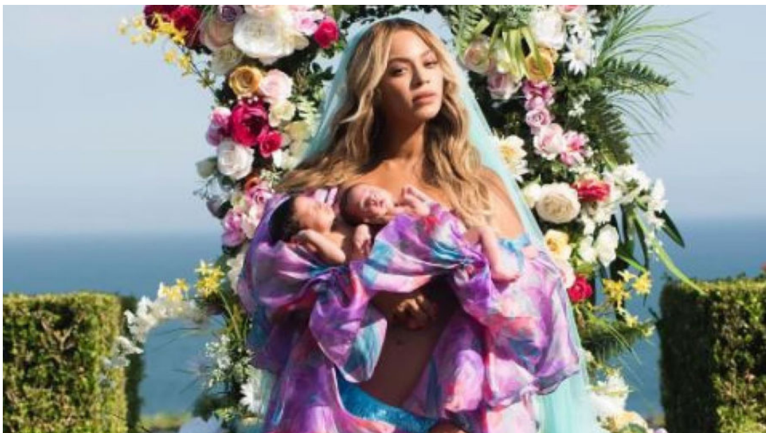
Abb. 6: Beyoncé mit ihren Kindern, 2017

Obwohl Beyoncé eine ihrer Schwangerschaften am ersten Tag des Black History Month verkündete und damit ein Bezug zu Black History entstand, wird einigen Kritiker*innen zufolge die Problematik von Schwarzen Frauen durch ihre visuelle Insze-