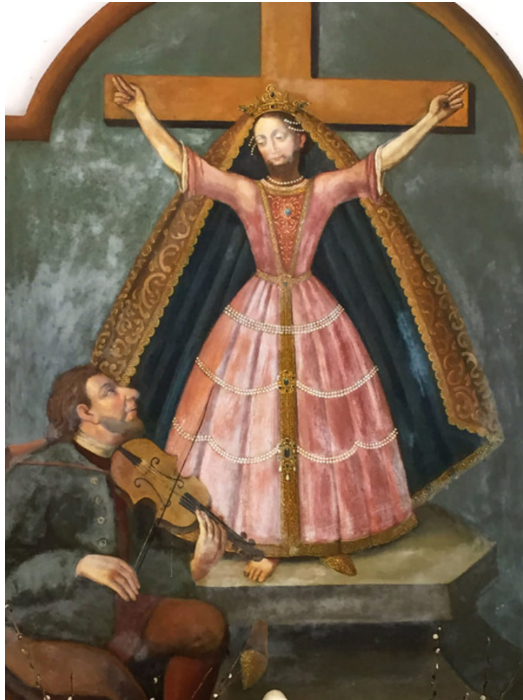
Abb. 3: Heilige Wilgefortis, Kapelle entlang der B25

Im damaligen Verständnis war das Sterben in der Nachahmung von Jesus Christus eine besondere Auszeichnung und es galt, mittels Kreuzigung zum männlichen Geschlecht zu transformieren und dadurch Christus ähnlicher zu werden. Dies wurde als eine Erhöhung für Frauen aufgefasst. Aktuell ist dieser Kult kaum geläufig, die Darstellungen sind weitgehend unbekannt oder von der katholischen Kirche zerstört worden. Lediglich im Kalender von Trans-Communitys ist die Heilige Wilgefortis als ‚Transvestie-Heilige‘ und als eine der historischen Anknüpfungslinien für Transpersonen immer wieder erwähnt.