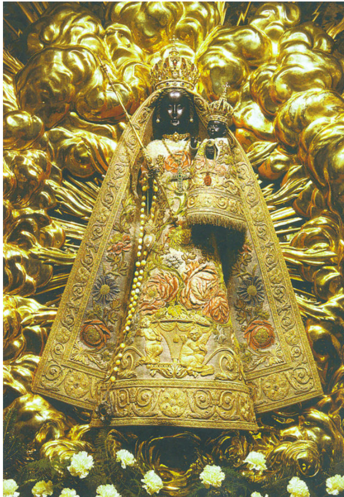
Abb. 7: Unbekannte/r Künstler*in: Schwarze Madonna vom Kloster Einsiedeln (CH), Mitte des 15. Jahrhunderts

Zusammenfassend zeigen die genannten Beispiele von Conchita Wurst und Beyoncé, dass Verschiebungen stattfinden und das ‚Heilige‘ subvertiert und profanisiert wird. Es geht dabei also um wiederkehrende religiöse Motive, die losgelöst von diesem Ursprung adaptiert wiederauftaucht, dabei aber Referenzen zu ihrer Herkunft aufweist. Im Sinne von Sigrid Weigel ist dies „eine Durchflechtung der säkularisierten Welt mit religiösen Deutungsmustern und eine Präsenz von unsichtbar gewordenen Zeichen der Religion in der profanen Kultur“ (Weigel nach Schaffer 2019: 31). Die ‚Durchflutung‘ unserer Alltagswelt mit ursprünglich religiösen Symbolen und deren ‚(Un-)Sichtbarkeit‘ sind verwoben mit unseren Sehgewohnheiten und geben dem Sakralen verbleibende Rest-Wirksamkeiten in profanen Bereichen. Die christlichen Zeichen und damit auch ihre Sprache in der visuellen Kultur oszillieren zwischen religiöser Entleerung und Aufladung, kapitalistischer und politischer Instrumentalisierung und den Möglichkeiten subversiver Geschlechterräume. Die Normen der Geschlechterordnung, Sexualität sowie sexuellen Orientierung werden dabei wiederholt, verschoben oder spielerisch in Szene gesetzt.