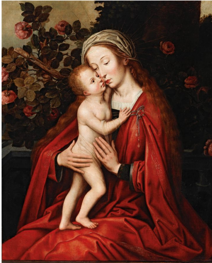
Abb. 4: Madonna und Kind im Rosenhag, Werkstatt von Ambrosius Benson, 16. Jhd.

großer Erfolg basiert u.a. auf Videos mit extremer Betonung von Sexyness und Erotik, die unschwer als feministisch bezeichnet werden können. Während ihrer beiden Schwangerschaften änderte sie ihr Image und entwarf sich in Anlehnung an Maria, die biblische Mutter Gottes als die ‚Heiligste‘ unter den Müttern (Abb. 4). Durch die Idealisierung von Mutterschaft mit den Eigenschaften mild, sanft und fürsorglich betont sie den Wert der Frau mittels Schwangerschaft. Eine markante Differenz zur christlichen Marienfigur liegt darin, dass sich Beyoncé hochschwanger und halbnackt zeigte. (Abb. 5 und Abb. 6) Die Sängerin spielt in diesen Bildern mit der vermeintlichen Asexualität und ‚Reinheit‘ Mariens und mit deren Überhöhung.