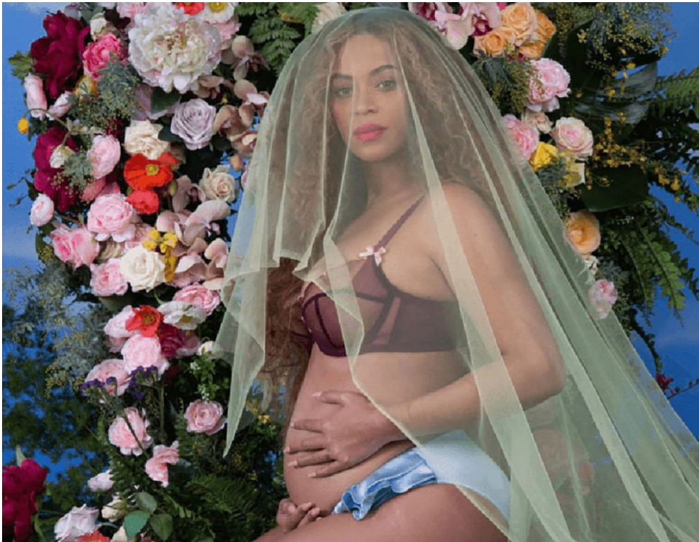
Abb. 5: Beyoncé, 2017